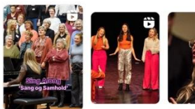
Wat was het bijzonder: de eerste Sing Along van Vocalink... 5 november 2025 · Duur 2:24

We zien dat het werken met beeld, en met name video, duidelijk beter werkt om mensen te bereiken en betrekken. Reels rondom evenementen en samenzang kregen meer likes en reacties en bereikten gemiddeld tussen de 1.500 en 2.500 weergaven, met een aanzienlijke kijktijd. Zie de voorbeelden hieronder van de Sing Along, het KoorEvent en Vocalink Festival Centraal.