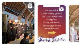
Een dag vol muziek, plezier en verbinding! Wij genieten n... 30 september 2025 · Duur 1:02