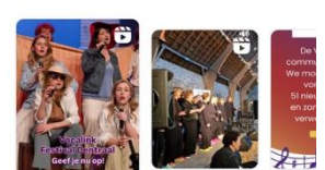
Een dag vol aanstekelijke optredens, uitwisseling en wor... 20 oktober 2025 · Duur 1:12